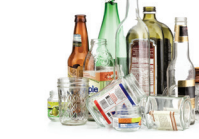
Botellas y frascos de vidrio