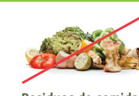
Residuos de comidas (¡úselos para compostaje!)