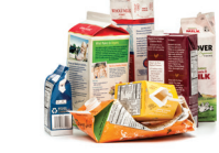
Cartones de alimentos y bebidas