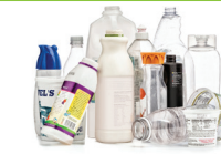
Botellas y envases de plástico