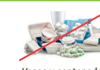
Vasos y contenedores de poliestireno (Vea opciones en Earth911.org .)

Para más información, visite: RecycleOftenRecycleRight.com