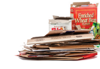
Cartón y cartulina aplastados