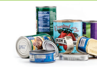
Latas de alimentos y bebidas