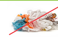
Bolsas y envolturas de plástico (Busque un sitio de reciclaje en plasticfilmrecycling.org .)