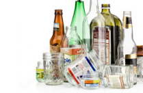
Botellas y frascos de vidrio