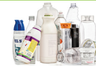
Botellas y envases de plástico