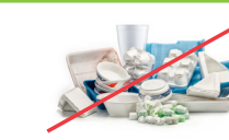
Vasos y contenedores de poliestireno (Vea opciones en Earth911.org .)

Para más información, favor de contactar a Waste Management al (815) 280-7854 o visite la página web de la Ciudad de Joliet en cityofjoliet.info .