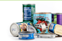
Latas de alimentos y bebidas