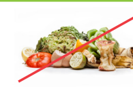
Residuos de comidas (¡úselos para compostaje!)