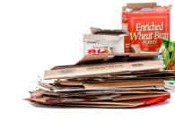
Cartón y cartulina aplastados