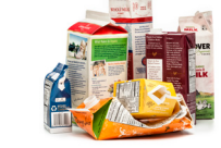
Cartones de alimentos y bebidas